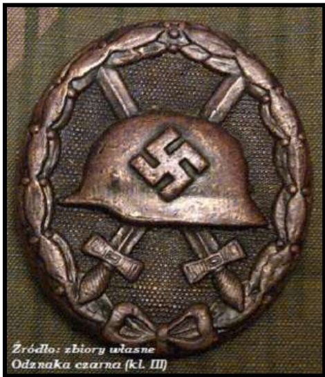
Odznaka czarna (kl. III)

Odznaka tzw. hiszpańska (nadawana ochotnikom niemieckim za wojnę w Hiszpanii) była praktycznie wierną kopią odznaki I wojennej. Jedyna różnica – umieszczona swastyka na hełmie wz. 16. W praktyce została przyznana 183 żołnierzom Ochotniczego Legionu Condor. Odznakę tę otrzymywali również żołnierze ranni w kampanii polskiej, zachodniej i norweskiej. Wykonywana była w formie tłoczonej z blachy stalowej lub odlewana z metali kolorowych.