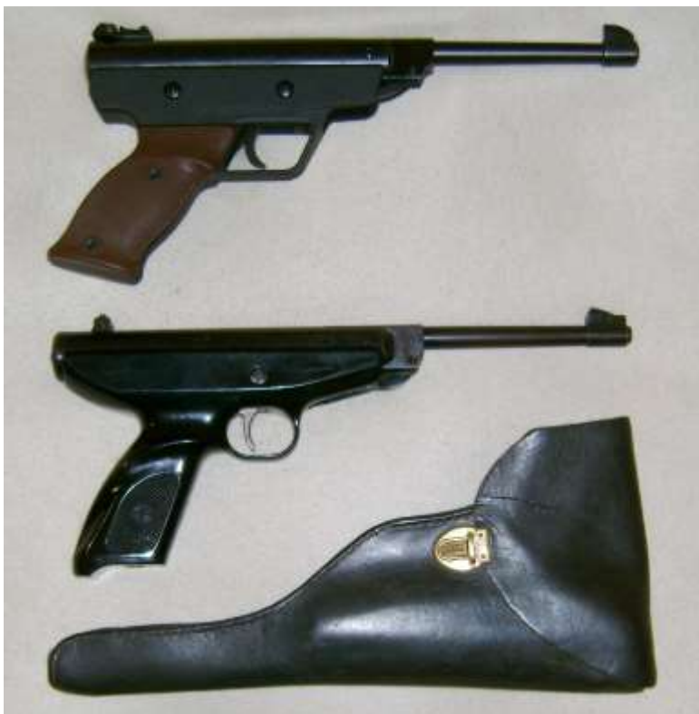
Diana mod.3 oraz Tex 086 z kaburą - futerałem