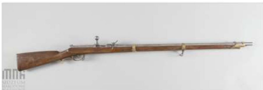
Karabin iglicowy systemu Dreyse, M1841

niemieckiej armii, iglicowy, powtarzalny karabinu typu Mauser wz. 1898, kalibru 7,9 mm. W najlepszym okresie fabryka zatrudniała 1200 pracowników i osiągała wydajność 500 karabinów dziennie. O rewelacyjnym karabinie Mauser wz. 1898 można więcej przeczytać w naszym Biuletynie Kolekcjonerskim Nr 27/2014 w tekście autorstwa kolegi Tomasa Okorskiego (zamieszczone zdjęcia pochodzą z tamtego magazynu).