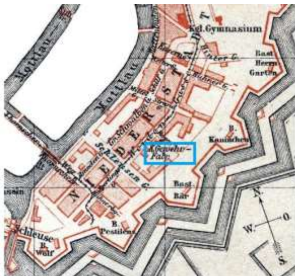
Plan Dolnego Miasta z 1885 r.