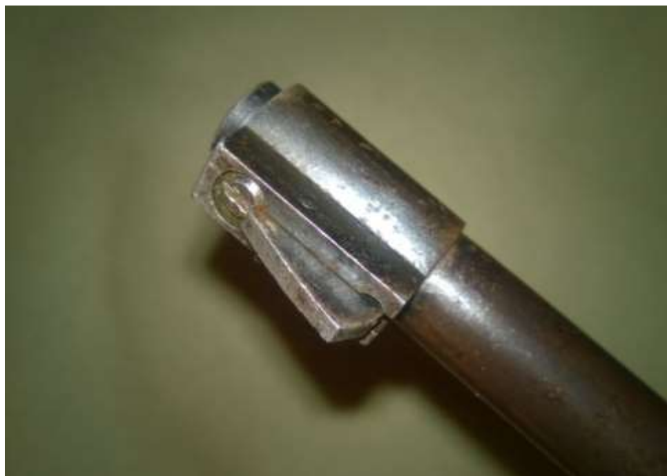
Regulowana muszka w Texie