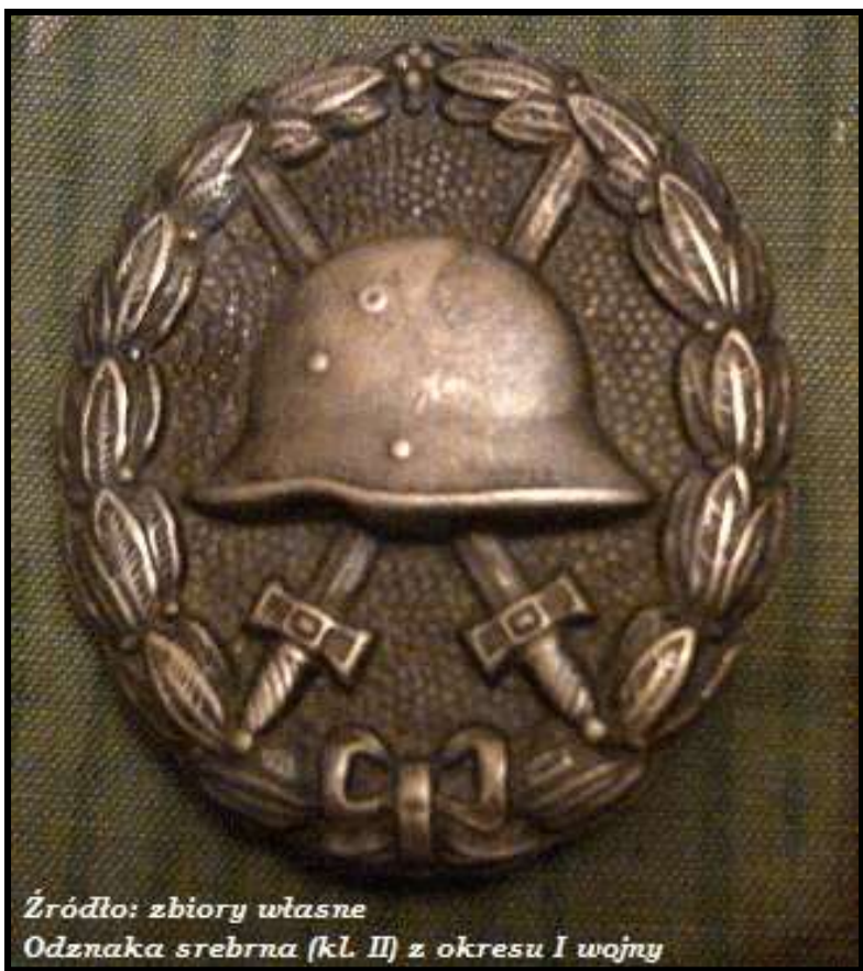
Odznaka srebrna (kl. II) z okresu I wojny

Odznaka wzoru 2 nadawana była w latach 1940-1945 i poddana została zasadniczym zmianom. Zwiększono jej rozmiar, tło przypominało strukturę lnianej tkaniny, miecze miały szersze ostrza, hełm zamieniona na wz. 35 a liście laurowe miały większe liście. Swastyka na hełmie nie uległa zmianie. Wykonywana była w formie tłoczony z blachy stalowej lub odlewana z metali kolorowych.