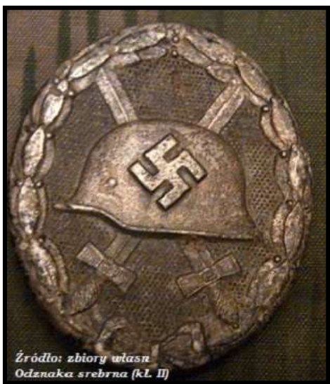
Odznaka srebrna (kl. II)

Została wprowadzona 1 września 1939 roku decyzją Adolfa Hitlera, który otrzymał podobną odznakę III klasy za rany zadane na froncie zachodnim podczas I wojny światowej. W marcu 1943 roku J. Goebbels zdecydował o przyznawaniu odznaki personelowi pomocniczemu w służbie Wehrmachtu, Luftwaffe, Kriegsmarine i Waffen-SS składającego się głównie z cywilów. Wyróżniamy trzy klasy odznaczenia: